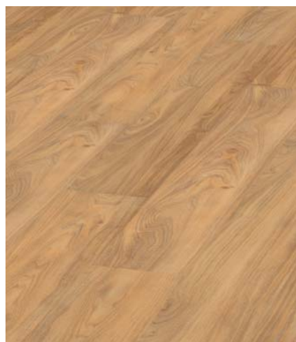
Summer Oak Objednací čísla: 5111 lepená 9111 click