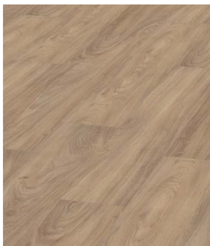
Autumn Oak Objednací čísla: 4111 lepená 8111 click