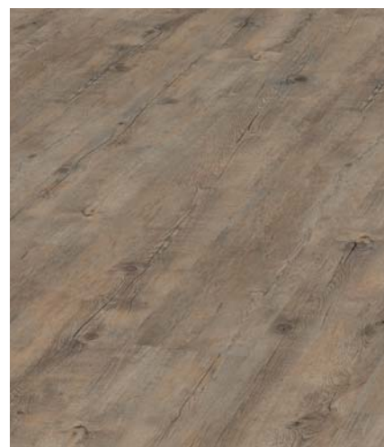
Winter Oak Objednací čísla: 3111 lepená 7111 click