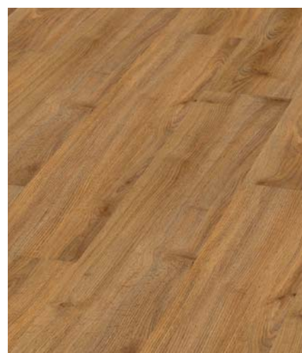
Spring Oak Objednací čísla: 2111 lepená 6111 click