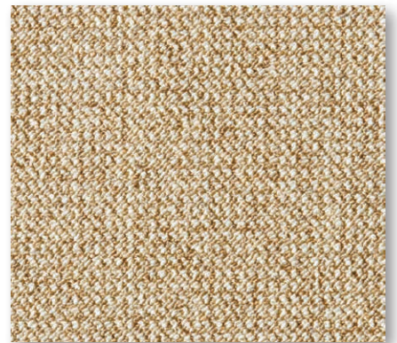
400+500 cm 31