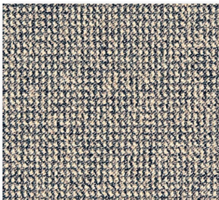
400+500 cm 90