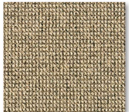
400+500 cm 39