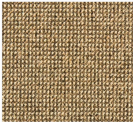
400+500 cm 45