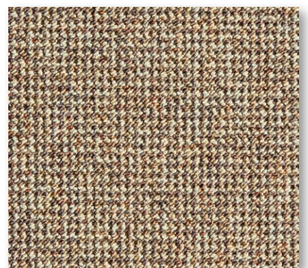
400+500 cm 40